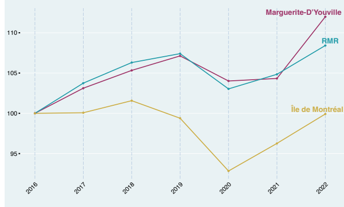
ÉVOLUTION DE L'EMPLOI PAR SECTEUR ÉCONOMIQUE, MRC DE MARGUERITE-D'YOUVILLE (EMPLOI > 200)

Les secteurs économiques correspondent aux catégories du SCIAN à 2 chiffres.